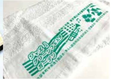
オリジナルタオル