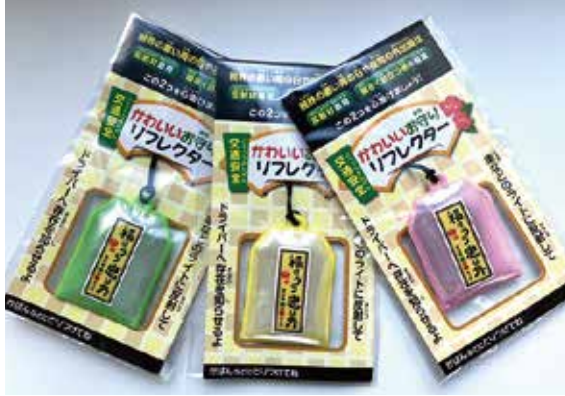
お守りノベルティ